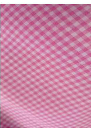
Kitambaa cha sketi ya michezo (Kitambaa cha kunguru, pink mpauko)