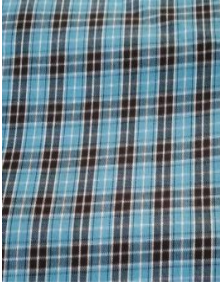
Kitambaa cha sketi ya shule