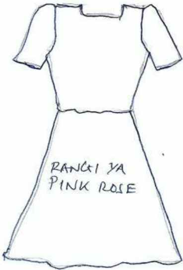
3. SHAMBA DRESS (GAUNI LA KUSHINDIA) - MBELE