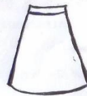
Sketi ya Michezo Njano