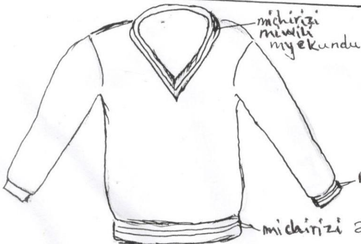
SWEATER (Grey) KIJIVU