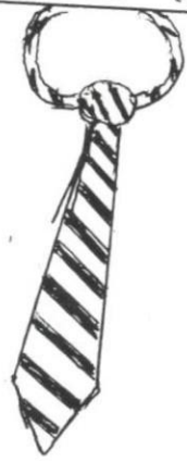
NECK TIE (TAI)