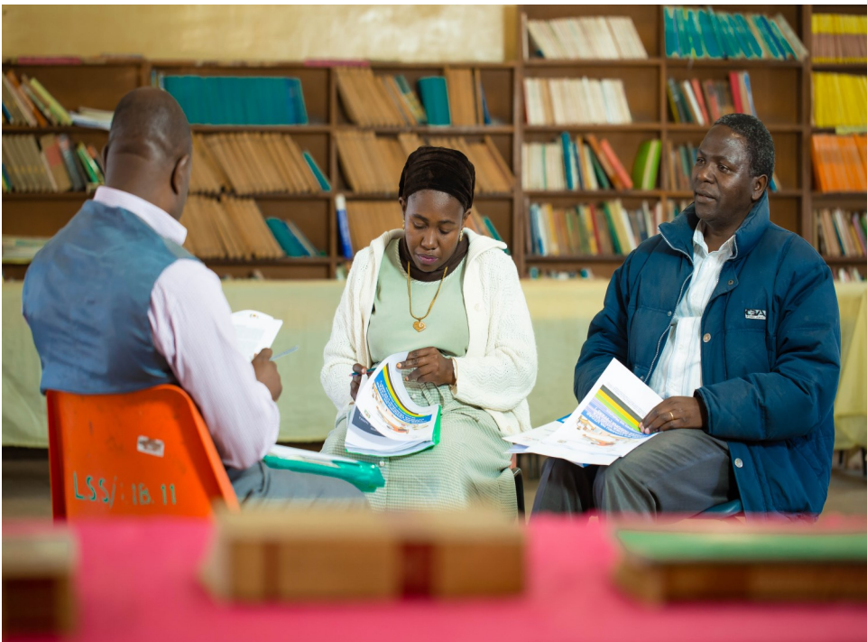
Baadhi ya watumishi wa Shule ya Sekondari ya Loleza jijini Mbeya, wakipata mafunzo ya FFARS kutoka kwa Mratibu wa Elimu Kata jijini humo.

kishwaji wa Raia, Rasilimali Watu, Rasilimali Fedha, Mifumo ya TEHAMA, pamoja na Taffiti Tendaji.