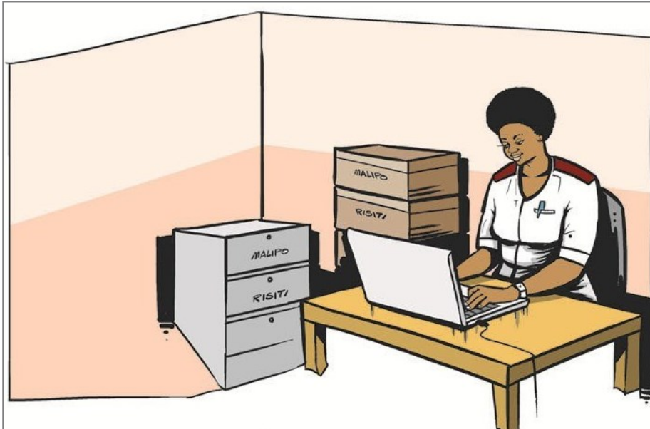
Mchoro ukionyesha mfano wa kuutumia mfumo wa FFARS kwa njia ya kielektroniki, katika kituo cha kutolea huduma. (Mchoro: Nathan Mpangala)

Luanda ameeleza kwamba kumekuwa na changamoto ya upatikanaji wa taarifa sahihi