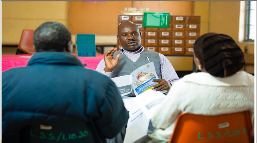
Baadhi ya watumishi wa Shule ya Sekondari ya Loleza jijini Mbeya, wakipata mafunzo ya FFARS kutoka kwa Mratibu wa Elimu Kata jijini humo.

Wengaa alitanabahisha kwamba mafunzo hayo yanafanyika katika mikoa 13 ya Tanzania bara inayotekeleza Mradi wa Uimarishaji wa Mifumo ya Sekta za Umma (PS3), ambapo waratibu elimu kata na waganga wafawidhi